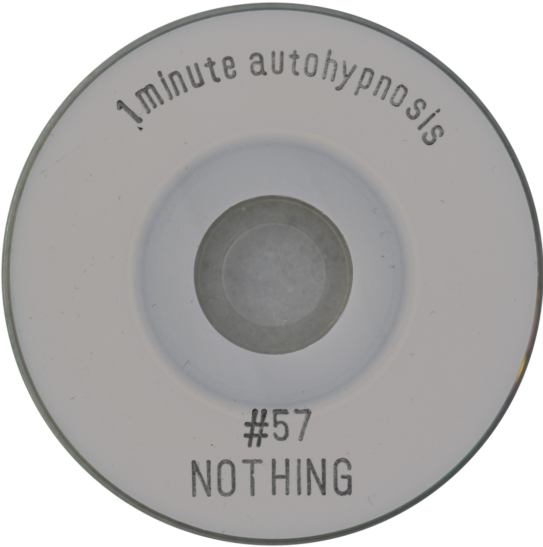
AA.VV. (2024). Mute Sound: 1 Minute Autohypnosis CD 57 . Zaragoza (España): Mute Sound. Disponible en: https://mutesound.org/autohypnosis/1-minute-autohypnosis-57/